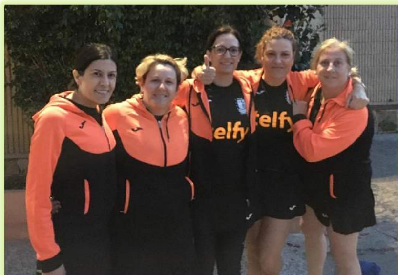
E Q U I P O B

NUESTROS EQUIPOS "A y B" continúan de enhorabuena: