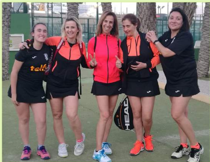
E Q U I P O A